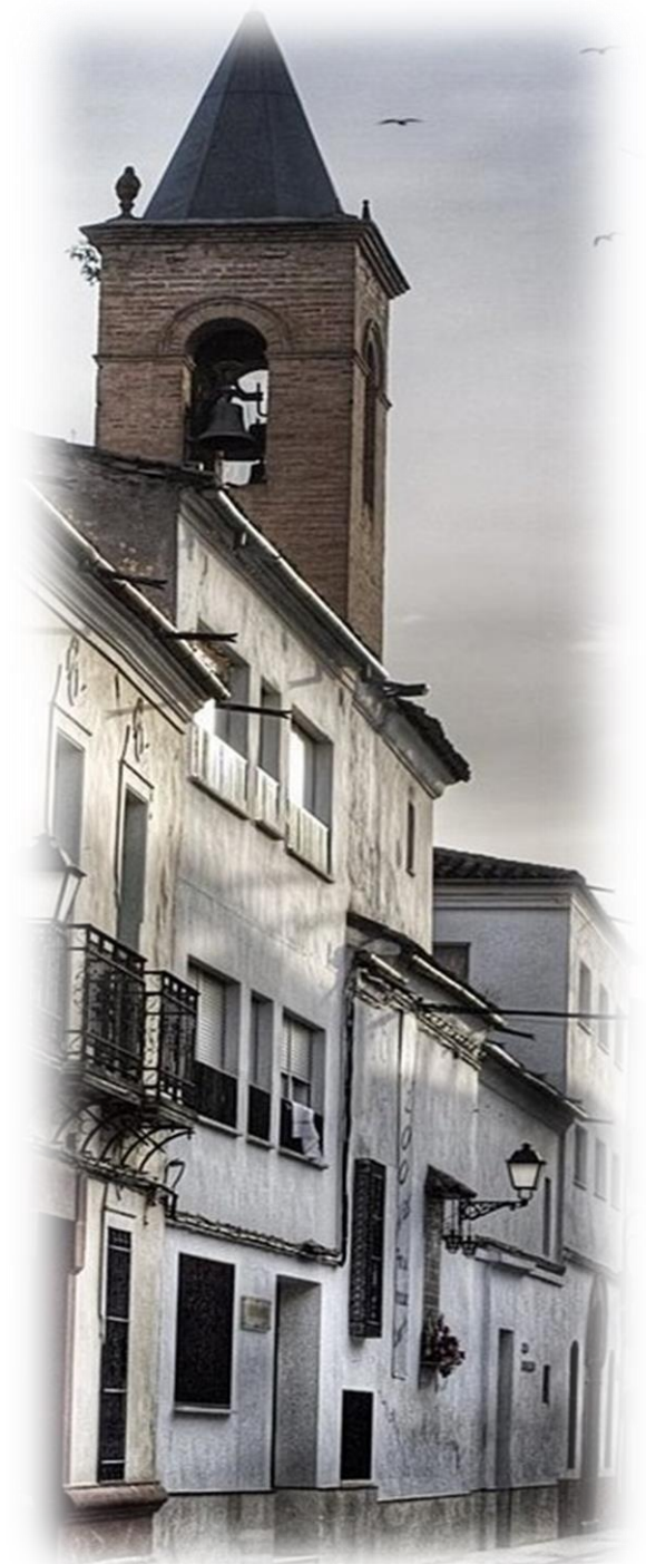
Colegio Divina Pastora Villa del Río